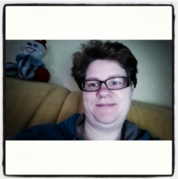
Gemaakt thuis op de bank