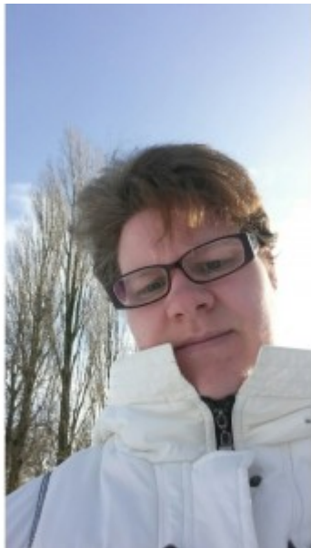
Gemaakt buiten in de sneeuw