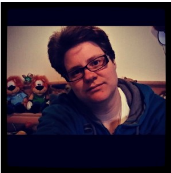
Gemaakt in de slaapkamer

Ik kwam via Jenn op het idee om mijn eigen project te starten met selfies. Niet elke dag zoals Jenn het doet maar 1 keer in de week, dat vind ik vaak zat. Ik ben best wel onzeker over zulke foto,s posten dus misschien is dit wel iets waarin ik kan groeien en wat zelfverzekerder kan worden over mezelf. Ik ga dus proberen elke week een selfie te maken, wat echt niet meevalt merk ik nu al. En dan elke maand deel ik ze met jullie.