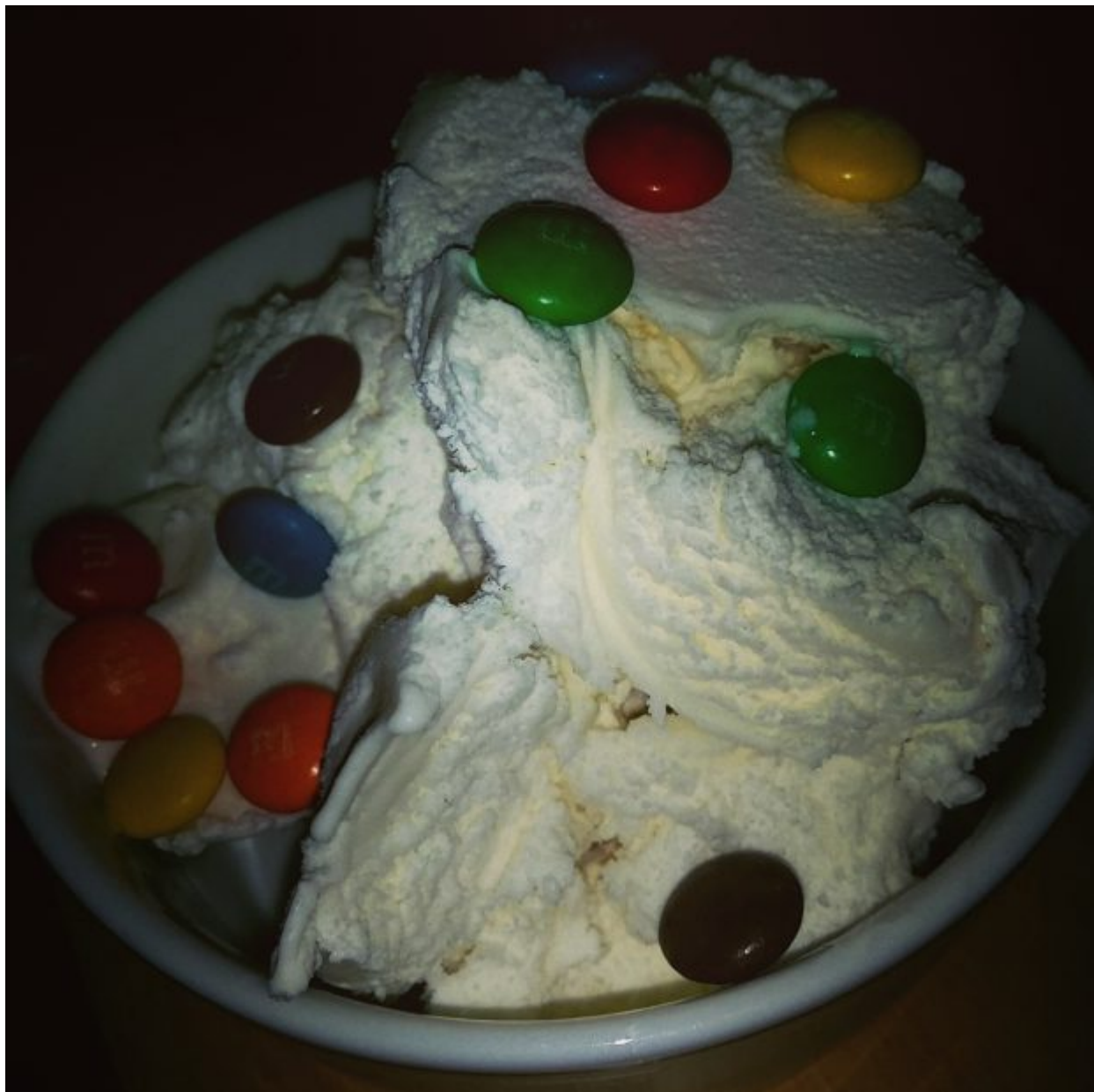
Slagroomijs met smartlies erop, even genieten.